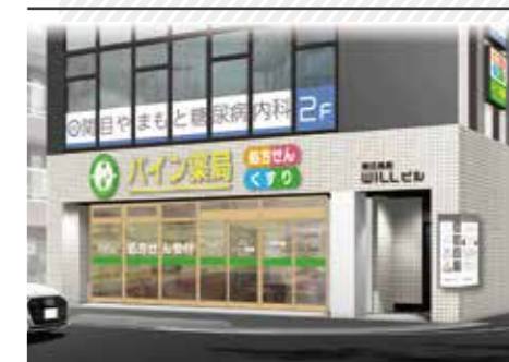
店舗外観(イメージ)